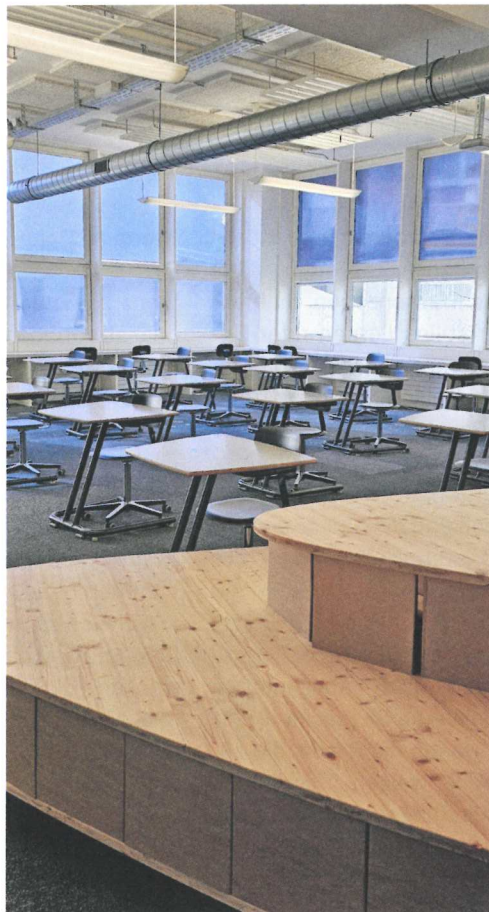
Die LS6 ist an diesem Vormittag leer, weil gerade keine Prüfung geschrieben wird.